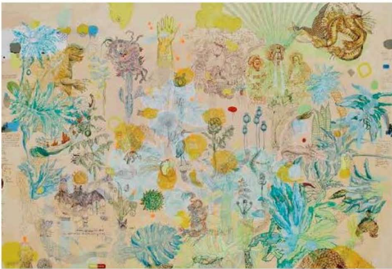
SIEMPRE FUIMOS ORDINARIOS