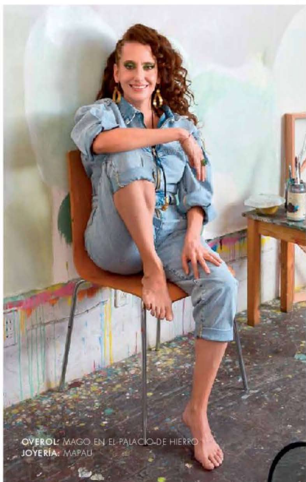
OVEROL: MAGO EN EL PALACIO-DE HIERRO JOYERÍA: MAPAU

“Elijo la pintura porque me interesa la acción del cuerpo, lo veo como un pincel, una herramienta que deposita una acción física en el material, no soy tanto de tener asistentes porque para mí pintar es un rito”.