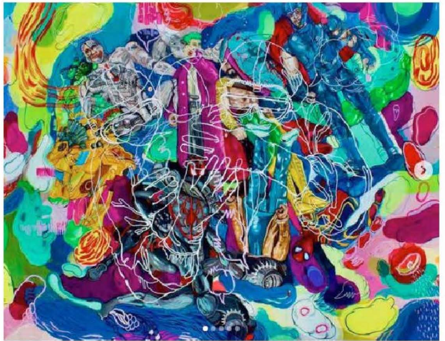
HISTORIAS DE PANDEMIA